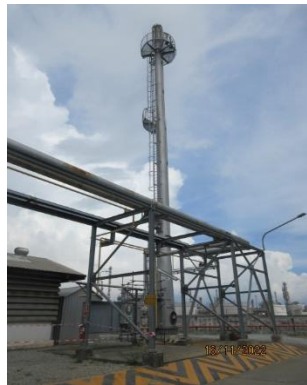
ภาพที่ 2.1-3 ระบบ Flare