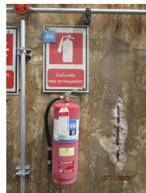
ภาพที่ 2.1-14 เครื่องดับเพลิง