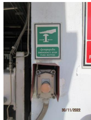
ภาพที่ 2.1-28 อุปกรณ์ตัดแยกระบบอัตโนมัติ