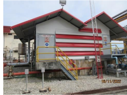
ภาพที่ 2.1-24 เครื่องสูบน้ำชนิดใช้กระแสไฟฟ้า