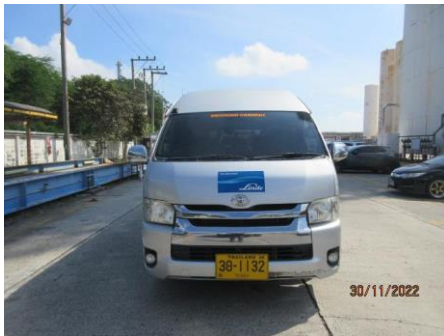
ภาพที่ 2.1-16 รถกรณีฉุกเฉิน