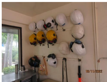
ภาพที่ 2.1-13 อุปกรณ์ PPE