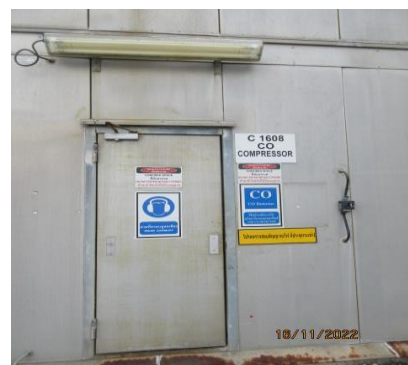
ภาพที่ 2.1-22 เครื่องตรวจจับก๊าซ CO