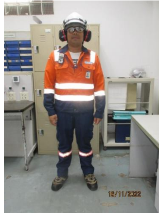
ภาพที่ 2.1-9 การสวมใส่อุปกรณ์ PPE