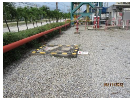
ภาพที่ 2.1-4 บ่อเก็บน้ำฝน