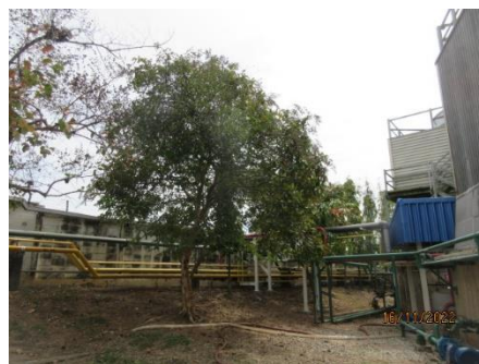
ภาพที่ 2.1-29 พื้นที่สีเขียวของโครงการ