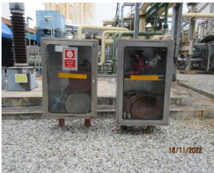
ภาพที่ 2.1-25 อุปกรณ์ดับเพลิง