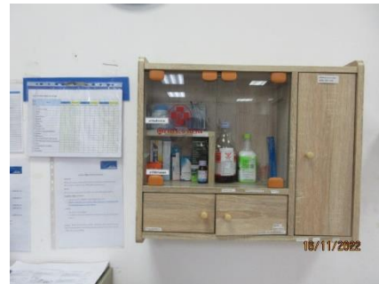
ภาพที่ 2.1-17 อุปกรณ์ปฐมพยาบาล และเวชภัณฑ์