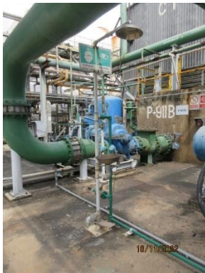
ภาพที่ 2.1-18 Eye Washer และ Shower