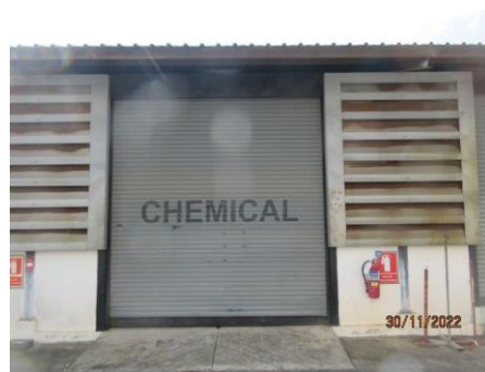
ภาพที่ 2.1-19 พื้นที่จัดเก็บสารเคมี