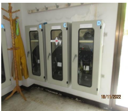
ภาพที่ 2.1-21 อุปกรณ์ป้องกันภัยจากก๊าซพิษ