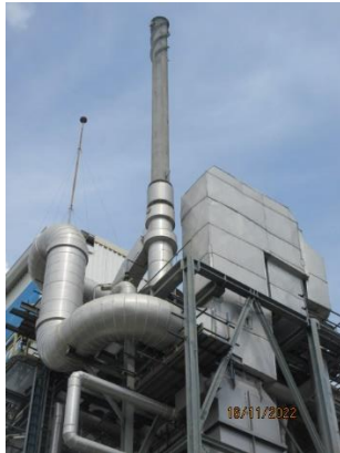
ภาพที่ 2.1-1 ปล่อง Reformer furnace