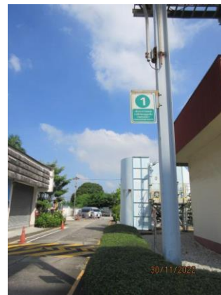
ภาพที่ 2.1-27 เส้นทางอพยพ