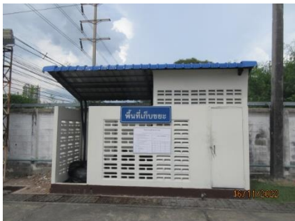
ภาพที่ 2.1-7 บริเวณอาคารเก็บกากของเสีย