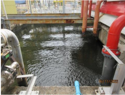
ภาพที่ 2.1-23 แหล่งน้ำดับเพลิง