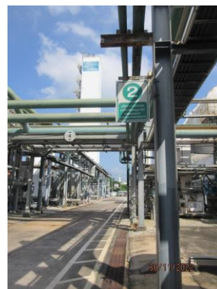
ภาพที่ 2.1-15 ป้ายทางออกฉุกเฉินและเส้นทางหนีไฟ