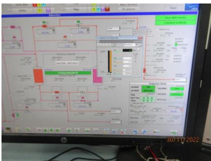
ภาพที่ 2.1-26 เครื่องตรวจวัดความชื้น