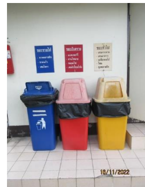
ภาพที่ 2.1-6 ภาชนะแยกตามประเภทภายในพื้นที่โครงการ