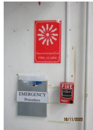
ภาพที่ 2.1-10 ป้ายเตือนและสัญลักษณ์ด้านความปลอดภัย