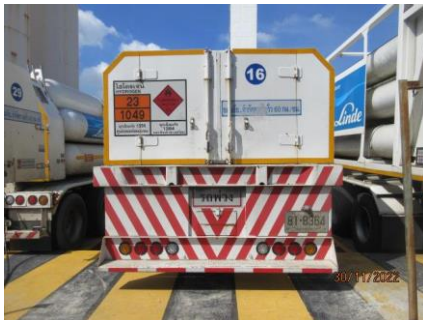
ภาพที่ 2.1-11 รายละเอียดบนรถบรรทุกสารเคมี/ ผลิตภัณฑ์