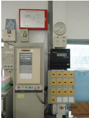
ภาพที่ 2.1-20 เครื่องตรวจจับก๊าซไวไฟ