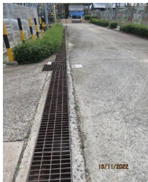
ภาพที่ 2.1-5 รางระบายน้ำฝนภายในโครงการ