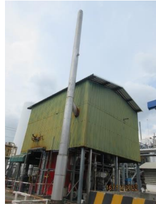
ภาพที่ 2.1-2 ปล่อง Boiler