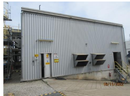
ภาพที่ 2.1-8 ติดตั้งอุปกรณ์ลดเสียง