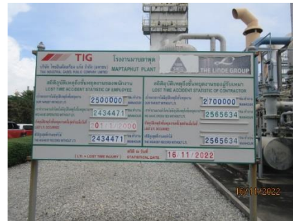
ภาพที่ 2.1-12 ป้ายสถิติอุบัติเหตุ